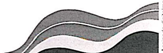
Anóar Abdul Samad Secretário de Estado de Saúde

HOMOLOGO as decisões contidas na Resolução CIB/AM Nº 140/2021, de 29 de junho de 2021, nos termos do Decreto de 28.06.2021.