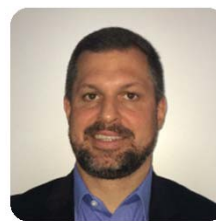
FÁBIO O'BRIEN ORGANIZAÇÃO