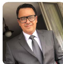
ALEXANDRE MAGNO IMPrensa