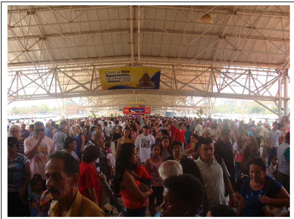
Com a Mãe Aparecida por um mundo sem AIDS – espaço testagem