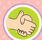
ABRAÇO E APERTO DE MÃOS