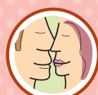
BEIJO NA BOCA