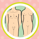
SEXO SEM CAMISINHA