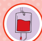
DOAÇÃO DE SANGUE