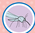
PICADA DE INSETO